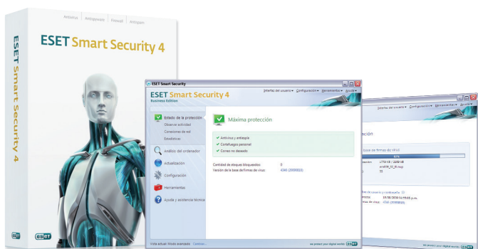
ESET Smart Security

El administrador podrá bloquear dispositivos extraíbles para evitar la propagación del malware, escaneando cualquier dispositivo que se conecte al equipo, utilizando la heurística avanzada de ESET.